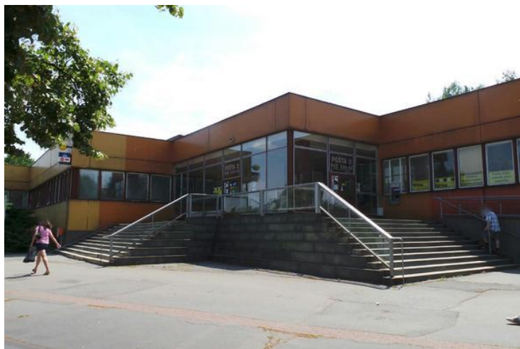
Česká pošta s.p., Pardubice 2