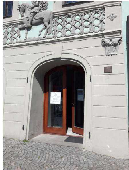
Vstup do galerie