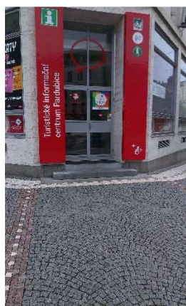
Turistické informační centrum (hlavní vstup)