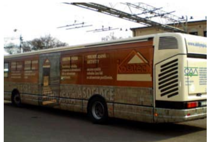
Na jaře loňského roku vyjel na linky pardubické městské hromadné dopravy tento nízkopodlažní autobus propagující aktivitu České abilympijské asociace.