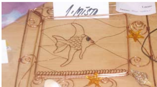
Loňské vítězné výrobky ze dvou soutěžních disciplín – keramika (levý snímek vpředu) a drátování