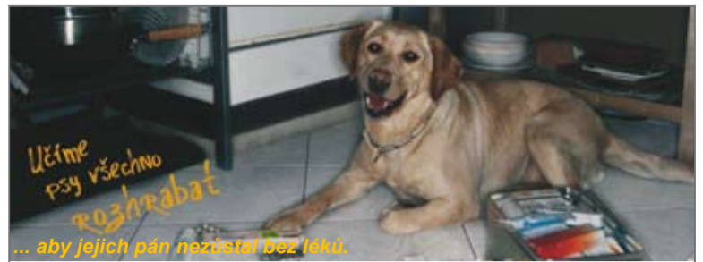
... aby jejich pán nezůstal bez léků.