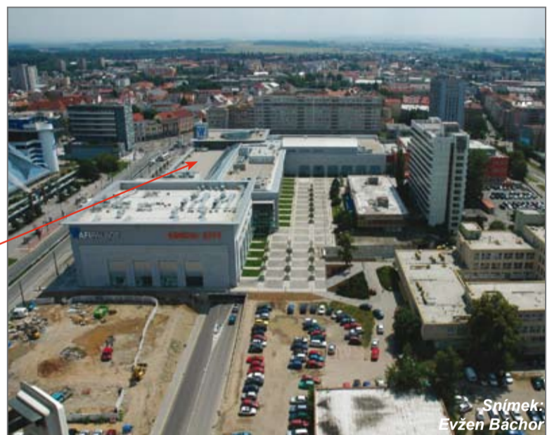
Prostor vlevo dole je v současnosti již upraven; snímek pochází z minulého roku.